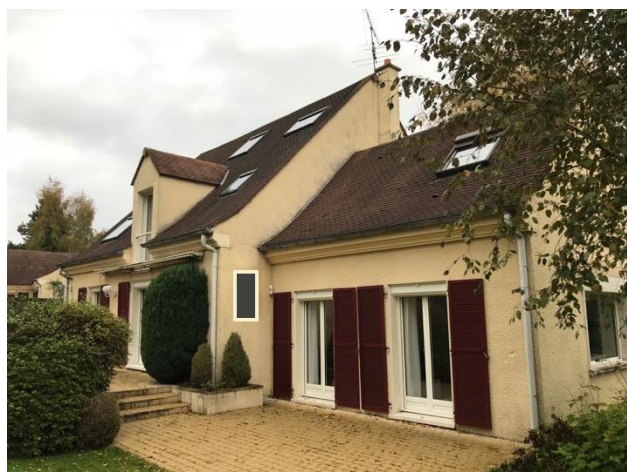
Vue depuis le jardin montrant la fenêtre