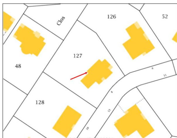
Plan cadastral (parcelle A127 – 8,rue Colette)