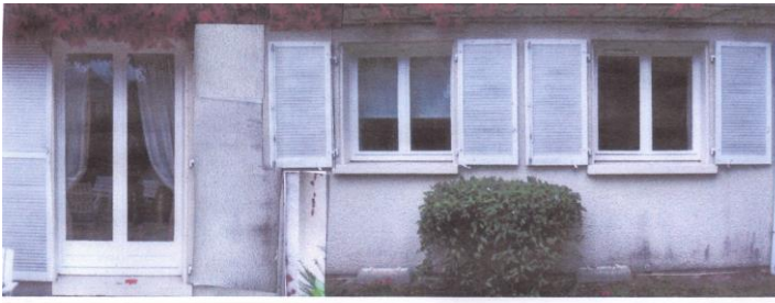
Façade Nord-Ouest actuelle avant modification