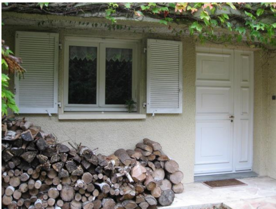
Façade Nord-Est actuelle avant modification