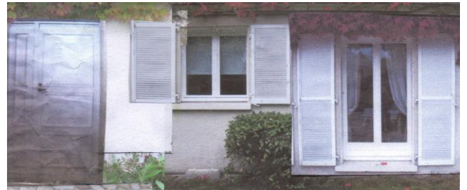
Façade Nord-Ouest après modification

II – Façade au Nord-est côté propriété ZAIAC (vue depuis le 7, rue St Mallarmé M. et Mme ZAIAC ( qui ont donné leur accord par écrit ))