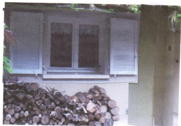
Après modif. (Porte murée et fenêtre allongée)

Question : L'assemblée Générale accepte-t-elle le déplacement de la porte d'entrée et l'agrandissement de 2 fenêtres, tel que décrit ci-dessus dans une maison de type « Mélèze » au 9, rue Stéphane Mallarmé (M.Delos) ?